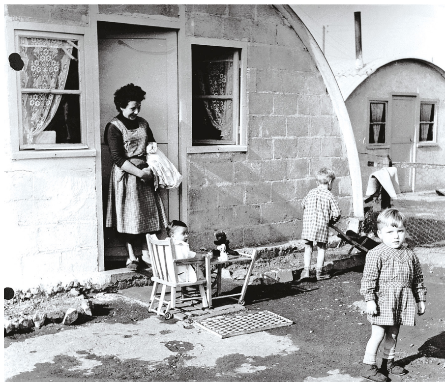
« Il y avait des igloos, en tôle ondulée, les uns à côté des autres, 250 familles, et le père Joseph en soutane, avec ses charentaises qui traînaient dans la boue », Catherine Seynes, comédienne du théâtre populaire