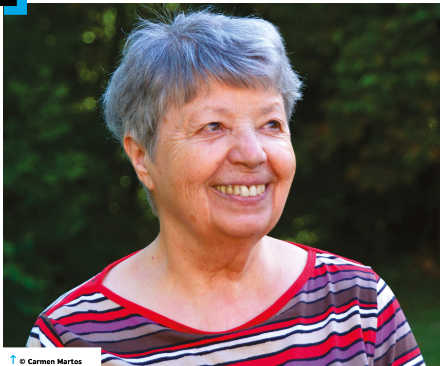
↑ © Carmen Martos