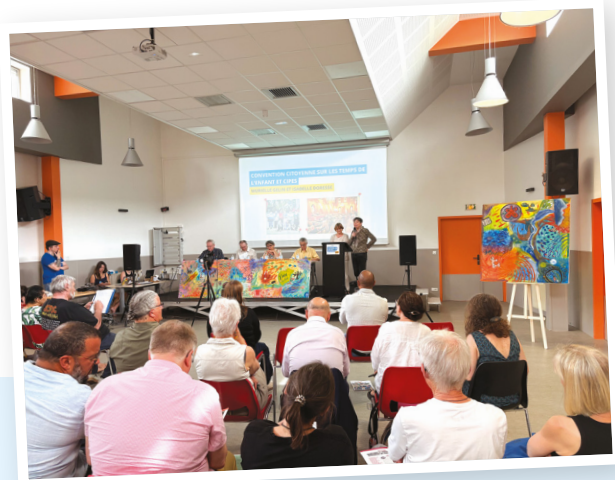
← © Lucile Chevalier

dernier, de ce plan, a laissé les associations pantoises. L'approche est court-termiste, les financements largement insuffisants, le plan n'affiche ni objectifs, ni trajectoires contraignantes pour les atteindre, ni évaluation. N'arrivant pas à se faire entendre, les ONG de l'Affaire du siècle (Oxfam France, Greenpeace France et Notre Affaire à Tous), aux côtés de 10 autres organisations et personnes impactées, ont déposé un recours pour dénoncer l'insuffisance de ce plan et demander sa révision. ■