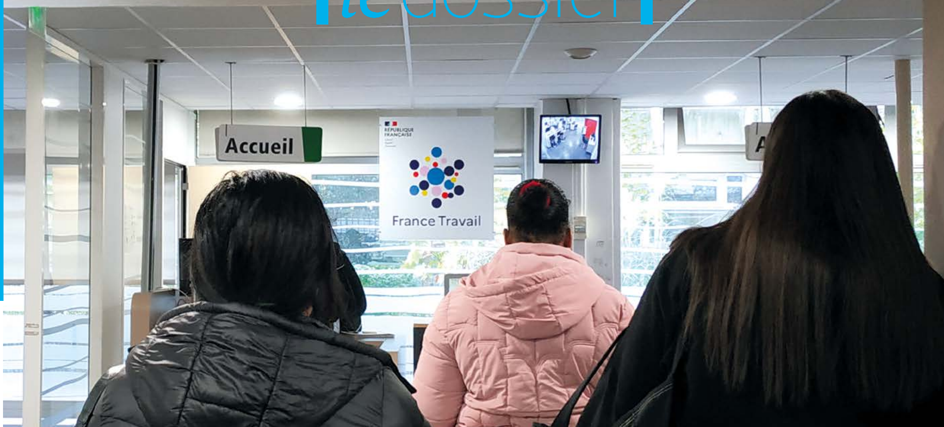
Une agence France Travail à Paris, novembre 2025