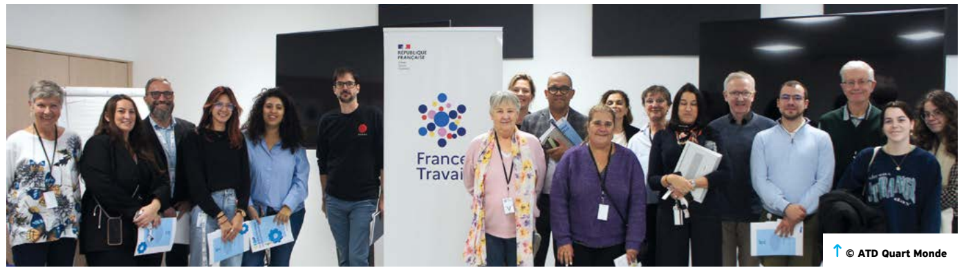
↑ © ATD Quart Monde

économique, social et environnemental, dans un rapport intitulé « Égalité des chances : mythe ou réalité ? », publié fin octobre. L'institution pointe notamment « la persistance voire l'aggravation » des inégalités de genre, mais aussi des inégalités territoriales ou face à l'emploi. En matière d'inégalités face au décrochage scolaire, elle dresse un constat accablant : « Le nombre de jeunes sortant du système scolaire prématurément est en nette augmentation, notamment en raison de la dégradation de leur santé mentale et l'omniprésence des écrans. » « Si, pour beaucoup, l'égalité des chances est un objectif politique crédible, pour d'autres, c'est une idéologie trompeuse : quelques réussites d'ascension sociale ne sauraient suffire à dire que l'égalité des chances règne », souligne le Conseil économique, social et environnemental, en rappelant que 76 000 jeunes sont sortis sans diplôme de l'école en 2021. Face à cette situation, il recommande notamment « d'améliorer les conditions de scolarisation en réduisant les effectifs par classe, en diversifiant les pédagogies, en aménageant les espaces et les temps scolaires ». Il insiste également sur « le rôle central des familles comme partenaires éducatifs et sur la nécessité de favoriser la coéducation et la mixité sociale pour que tous les enfants puissent réussir ensemble ». ■