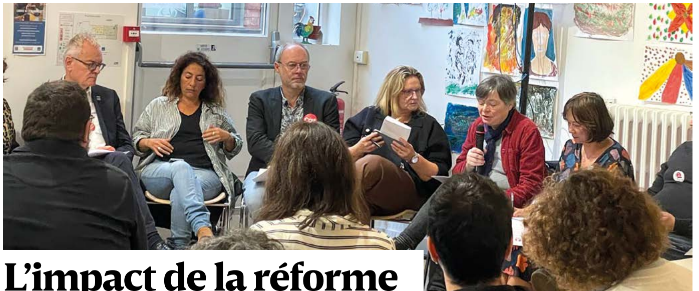
↑ © Camille Ménard, ATD Quart Monde

Dans une lettre adressée au gouvernement français, il a pointé les risques pour les allocataires, mais aussi pour la France, qui met ainsi « en péril » ses obligations internationales en matière de droits humains. Dans une tribune publiée par le journal Le Monde le 22 octobre dernier, il a également dénoncé « une guerre contre les pauvres plutôt que contre la pauvreté ». ■