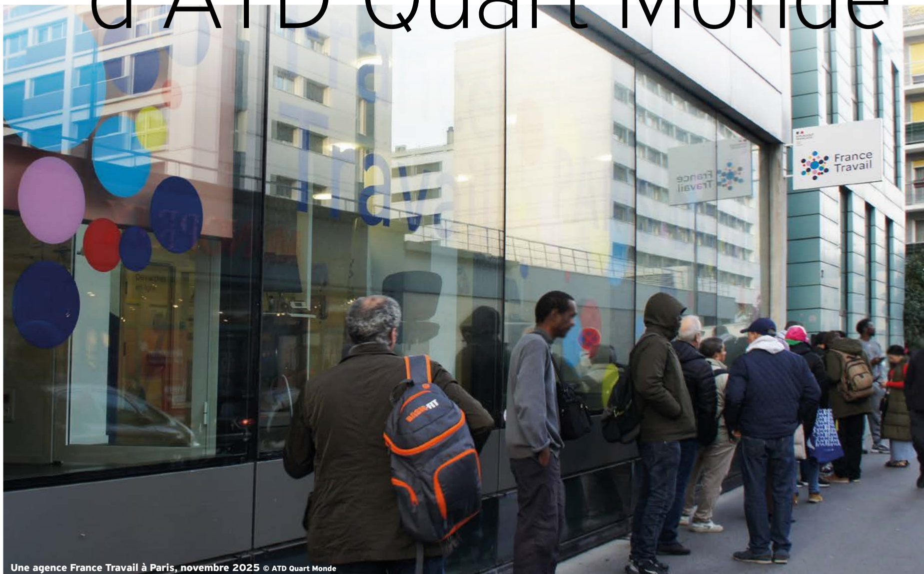
Une agence France Travail à Paris, novembre 2025