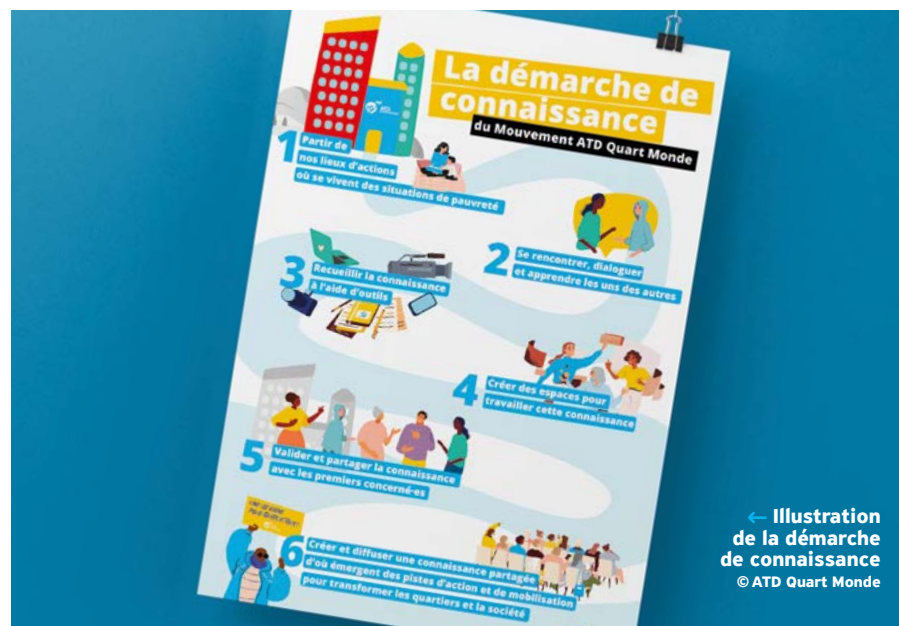
← Illustration de la démarche de connaissance © ATD Quart Monde

Pour en savoir plus : pole.dialogueactionconnaissance@atd-quartmonde.org