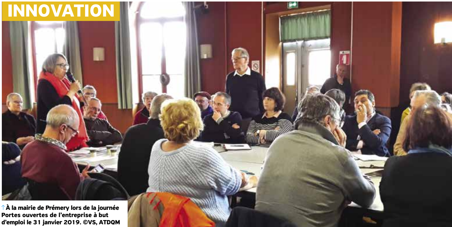
↑ À la mairie de Prémery lors de la journée Portes ouvertes de l'entreprise à but d'emploi le 31 janvier 2019.