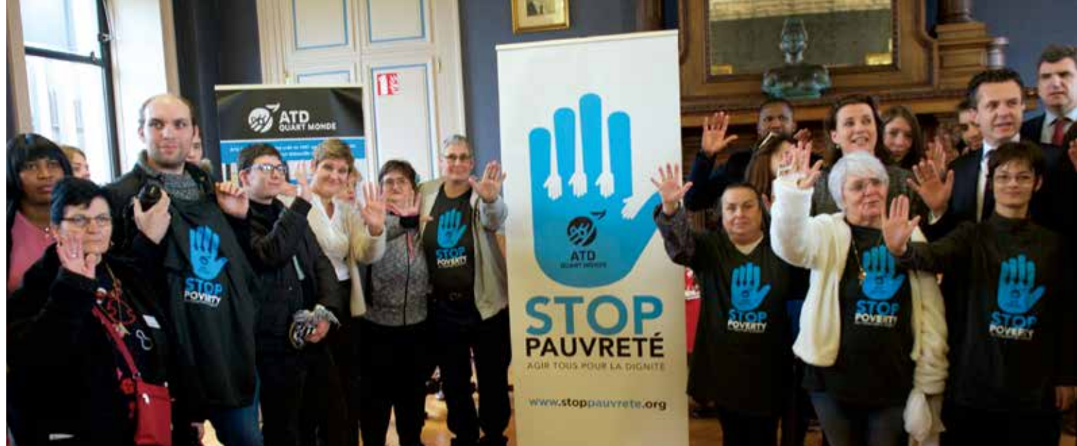
↑ À la mairie d'Angers le 12 février 2017, la délégation d'ATDQM brandit la main de la mobilisation 2017 Stop Pauvreté.

Le suffrage universel est le droit de vote reconnu à tous les citoyens. Il est égal et secret, pour que chaque voix pèse d'un même poids et s'exprime librement.