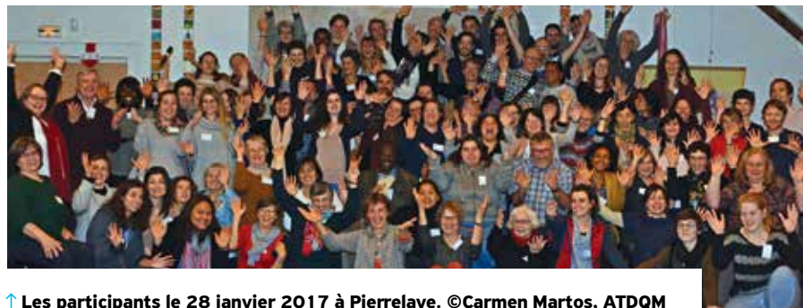
↑ Les participants le 28 janvier 2017 à Pierrelaye.