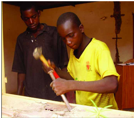
Ph. ATD Quart Monde/Cour aux cent métiers/Burkina Faso.