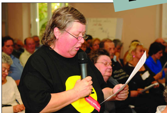
Ph. Efpaix/ATD Quart Monde/ Université populaire Quart Monde européenne, Marseille.

Après un an de travail pour informer et impliquer les différents partenaires du quartier, le projet pilote de Maurepas a démarré en 2008. Il a pour objectif de favoriser la réussite éducative et scolaire de tous les enfants, en créant les conditions d'une plus grande connaissance et confiance réciproque entre les parents, les enseignants et les enfants. Sa priorité est d'atteindre les parents les plus éloignés de l'école et de développer une relation avec les autres parents, les enseignants et partenaires, pour que les enfants des familles les plus exclues trouvent à l'école les conditions permettant leur réussite. Pour qu'il soit vraiment pilote et puisse être utile à d'autres, ce projet intègre une importante dimension recherche-évaluation. L'évaluation externe sera réalisée par l'Université Rennes2 et une évaluation interne sera effectuée sous la responsabilité du groupe de pilotage (constitué de représentants des six partenaires institutionnels), d'enseignants, de directeurs d'école et parents d'élèves des écoles du quartier et d'animateurs de groupes. Un projet de 5 ans pour changer profondément les relations entre les familles les plus pauvres et l'école.