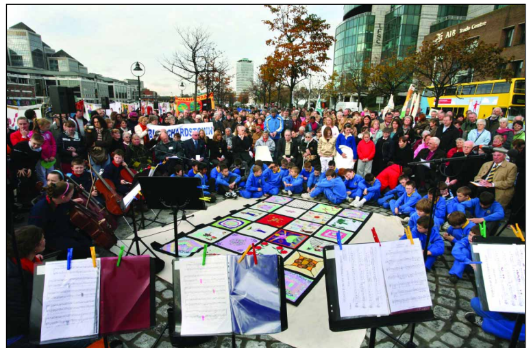
17 octobre 2008, à Dublin, Irlande.

À l'occasion du 20 e anniversaire du décès de son fondateur, le père Joseph Wresinski, ATD Quart Monde a organisé du 17 au 19 décembre 2008 un colloque international : « La démocratie à l'épreuve de l'exclusion - Quelle est l'actualité de la pensée de Joseph Wresinski ? » dans les locaux de l'école des Sciences Politiques de Paris. Ce colloque, préparé par plusieurs journées de travail, en Europe, en Haïti, aux États-Unis et en Thaïlande, a rassemblé plus de 300 participants, universitaires, acteurs de terrains, personnes en situation de pauvreté, venus d'une trentaine de pays. (Pour en savoir plus : http://www.atd-quartmonde.org/Colloque-La-democratie-a-l-epreuve.html ).