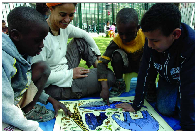
Ph. ATD Quart Monde/Bibliothèque de rue, Paris 18ème.

Elles vivaient dans des cases totalement insalubres, dont beaucoup ne disposaient ni d'eau ni d'électricité, dans une impasse fermée par un grand portail qui les soustrayait au regard. En 2008, ces familles, grâce à l'action d'ATD Quart Monde, d'un groupe « Accès aux droits fondamentaux » et de personnes de la municipalité, de la préfecture et de la direction régionale de l'Action sanitaire et sociale, ont pu enfin être relogées dans des conditions normales. Ce fut le fruit d'un lent chemin qui a permis de dépasser les peurs, de faire comprendre à d'autres leur réalité de vie et de rassembler autour d'elles. Elles ont relevé la tête, non pour réclamer une application "mécanique" de certains droits, mais pour être reconnues comme sujets et acteurs de droit, non seulement pour elles-mêmes mais pour d'autres ; le droit d'habiter quelque part. C'est en février 2009 que le dernier relogement est intervenu.