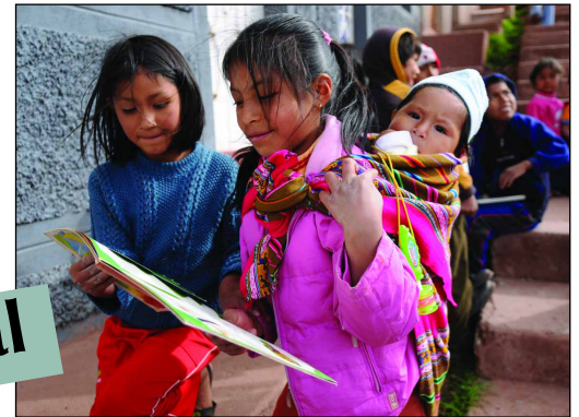
Ph. ATD Quart Monde/Bibliothèque de rue, Pérou.

En 2008, l'équipe d'Haïti a poursuivi son engagement pour l'accès à la santé des familles très pauvres de la zone périphérique Sud de Port-au-Prince. Le projet permet à 200 familles d'accéder à des soins de santé de qualité à un prix très bas, en complément d'activités destinées aux bébés et à leurs parents, de formations à la santé et des actions régulières d'ATD Quart Monde pour permettre l'expression et la participation de tous.