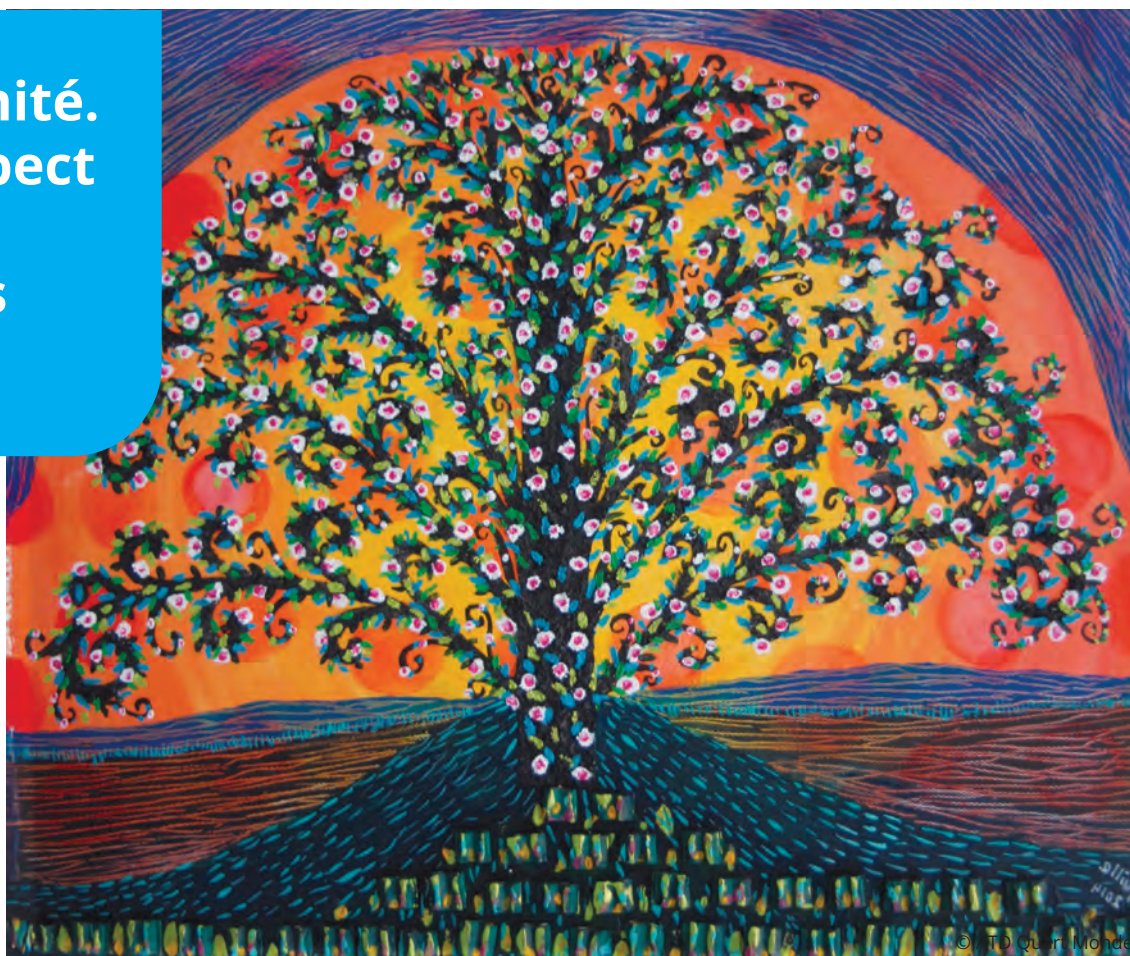
Peinture de Guillermo Diaz, volontaire chez ATD Quart Monde

Pour la dignité. Pour le respect de la Terre. Pour toutes et tous.