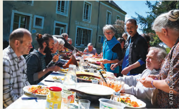
Repas collectif à la Maison Partagée de Nogent-le-Rotrou

À la Maison Partagée, justice sociale et écologie avancent ensemble. Prendre soin de la terre, c'est aussi reconnaître la dignité de chacun et renforcer le pouvoir d'agir collectif.